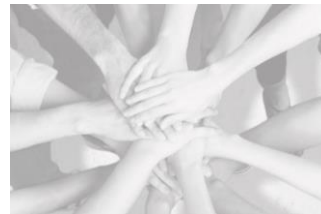
Team C Spitex